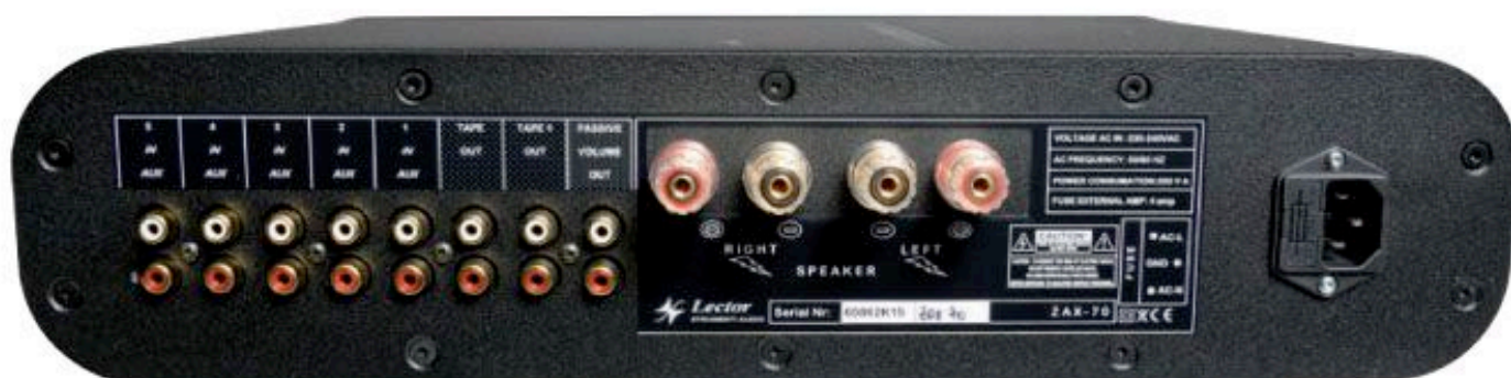
La connectique rationnelle comprend les entrées lignes, des sorties de monitoring, une autre située en sortie du potentiomètre de volume et quatre bornes universelles de qualité pour le raccordement aux enceintes.

Lecteur Nagra CDP Convertisseur Reimyo DAP-999EX Câble audio AES Absolue Créations Câbles d'enceintes Absolue Créations Enceintes Pierre-Etienne Léon Maestral